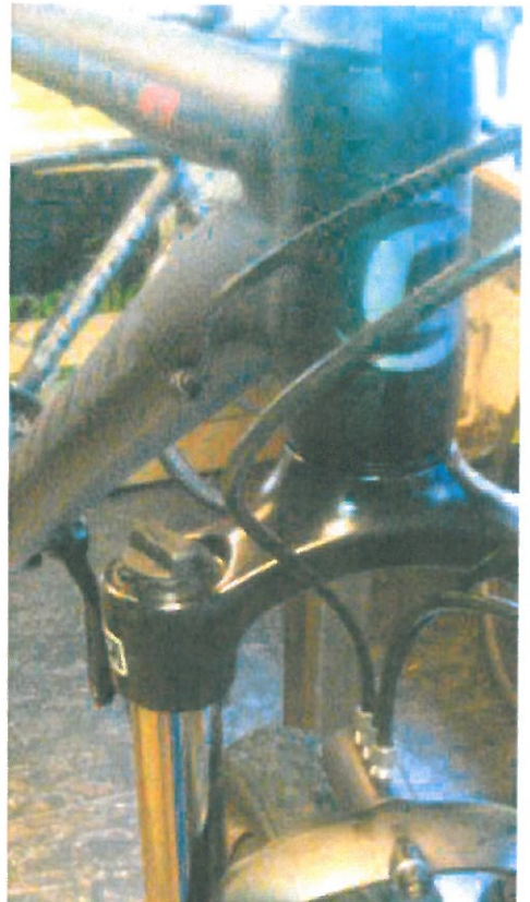
Den speciallavede cykel er bygget, så bremsegrebet i venstre side på de hydrauliske bremser virker mest på baghjulet og mindre på forhjulet samtidig. Foto: Henrik Falkenfleth

Når Henrik Falkenfleth kaster sig ud i endnu et uprøvet cykel-terræn, er det hver gang en udfordring, som han ikke ved, om kan lykkes. Men det skal i hvert fald prøves af først, og det er ikke pengene, der dri-