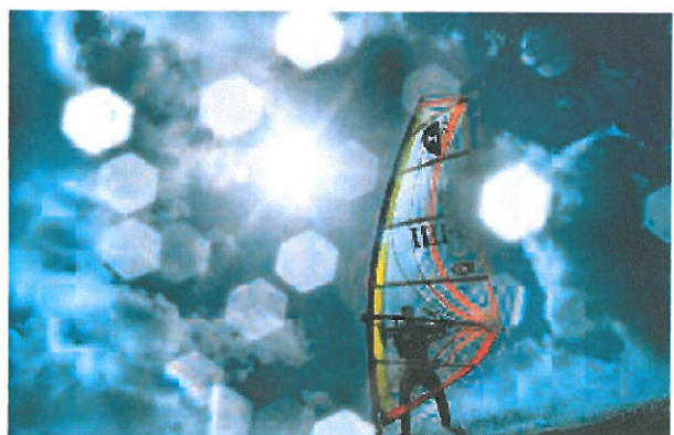
I uge 29 ser det ud til at blive rigtigt sommervejr herhjemme. Surferen her er fanget ved en tidligere lejlighed.

ud at blive omkring - eller lidt over - det normale på grund af